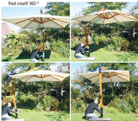
Pied rotatif 360°

CRÉATION-RÉALISATION SOPHIE PEYRUCQ : 05 59 22 21 57 - www.speyrucq.com